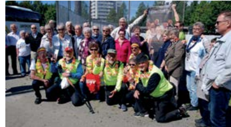
Kävelypässit ja raisiolaiset kävelijät vastaanottojoukkoineen perillä Porissa.