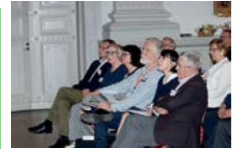
Eläkeläisliittojen etujärjestö EETU ry:n perinteinen Eläkeläisparlamentti järjestettiin 6.10. Helsingissä.

Toiminnanjohtaja on SOSTE:n hallituksen jäsen ja osallistuu myös SOSTE:n vanhusverkoston toimintaan. Hän oli yhtenä SOSTE:n edustajana Työ ja elinkeinoministeriön hankintalain-