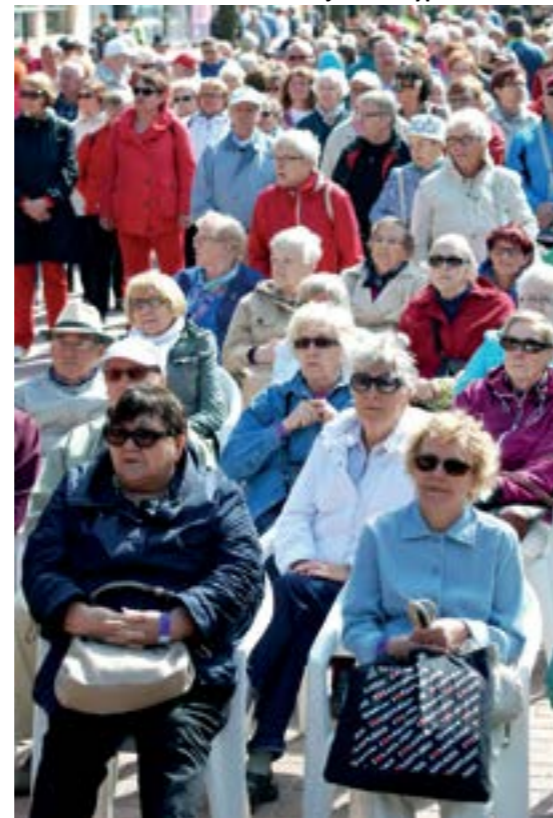
Kulttuuri- ja retkeilypäivät Porissa

Lakisääteisiä eläkkeitä maksettiin vuonna 2015 yhteensä noin 28,3 miljardia euroa, joista työeläkkeitä oli 25,3 miljardia euroa eli 89 prosenttia kaikista eläkkeistä.