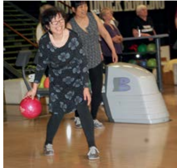
Kontulan Eläkeläiset ry kutsui Helsingissä kiinalaisia iäkkäitä keilaamaan.

Syksyllä järjestimme tukihenkilötapaamisen kaikille monikulttuurisessa toiminnassa mukana oleville yhdistyksille. Tapaamiseen osallistuttiin Helsingistä, Tampereelta, Jyväskylältä, Kuopiosta, Iisalimesta, Rovaniemeltä, Oulusta, Keravalta, Järvenpäästä ja Varkaudesta. Nopeasti kasvanut turvapaikanha-