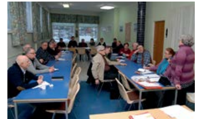
Pohjanmaan aluejärjestön Kohti edustajakokousta-työpäivä pidettiin Pietarsaareissa.

Kohti edustajakokousta -työpäivillä perehdyttiin edustajakokouksen työskentelyyn ja jäsenten aloiteoikeuden merkitykseen osana järjestön toiminnan painopisteiden valintaa. Työpäivillä käytiin lisäksi keskustelua eduskuntavaaleista mahdollisuutena tuoda esille järjestön ikääntymispoliittisia tavoitteita. Työpäivillä keskusteltiin myös valmis-