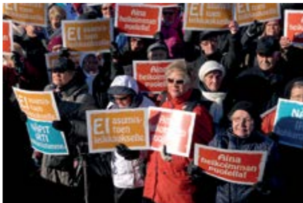
Heikoimman puolella -mielenosoitus

Lain säätämisen yhteydessä eduskunnassa annetut lupaukset ympärivuorokautisen hoidon mitoituksen saattamisesta säädöstasolle on jo tyystin unohdettu. Mitoituksen sitovuutta on heikennetty ja laatusuosituksen aiempia kirjauksia ollaan edelleen