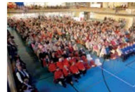
Kulttuuri- ja retkeilypäivät Porissa kesäkuussa 2015

25-vuotiaiden suomalaisten eläkkeellesiirtymisiän odote vuonna 2015 oli 61,1 vuotta ja vastaava 50-vuotiaiden odote 62,8 vuotta. Vuoden 2009 sosiaaliturvan ja sittemmin eläkeuudistuksen tavoit-