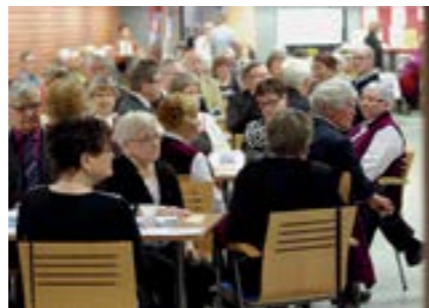
Lahden Eläkeläiset vietti helmikuussa 55-vuotisjuhlia.

”Eläkeläistoiminnan ydin ovat paikallisyhdistykset.”