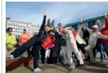
Kulttuuri- ja retkeilypäivät Porissa kesäkuussa 2015

Eläkkeiden ja ikääntyvän väestön tarvitsemien palvelujen rahoitus turvataan parhaiten harjoittamalla työllisyyttä lisäävää ja kansalaisten kulutuskysyntää tukevaa aktiivista talous- ja työllisyyspolitiikkaa.