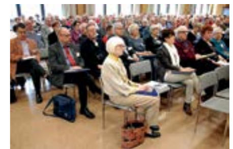
Edustajakokous koolle Kuntorannassa.

”Vuoden alussa hallitusta työllisti sääntömääräisen edustajakokouksen ja pitkin kevättä Porin kulttuuri- ja retkeilypäivien valmistelut. Syksy käynnistyi yhdessä Eläkkeensaajien keskusliitto EKL:n kanssa koolle kutsutun Heikoimman puolella mielenilmauksen valmisteluilla. Järjestön omistaman Kuntorannan ja Kuntoranta Oy:n strategiset kysymykset työllistivät hallitusta pitkin vuotta.”