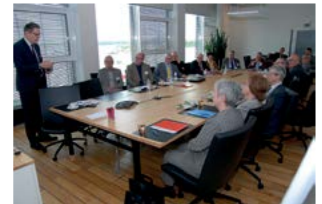
Eläkeläisliittojen etujärjestö EETU ry:n kevätkokous pidettiin Eläkevakuutusyhtiö Varman tiloissa.