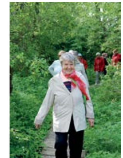
Kävelytapahtuma Kirjurinluodon maisemissa.