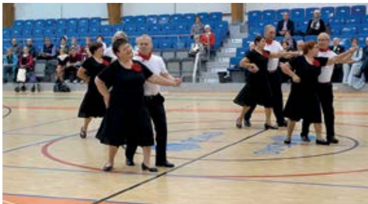
Kotkan Eläkeläisten Komeetta-ryhmän esitys Kotkan ruusu säväytti veteraanien kulttuurikilpailun ryhmätanssin sarjassa.

Neljä seuraavaa palkintoa sisälsi liikunta-aineistoa. Palkinnot jaettiin Tikkurilan, Raison Seudun, Rytikarin ja Etelä-Espoon yhdistyksille. Henkilöjäsenten suoritusmerkinnöillä täyttämät kävelypassit osallistuivat lisäksi arvontaan, jonka palkintoina oli muun muassa lahjakortteja.